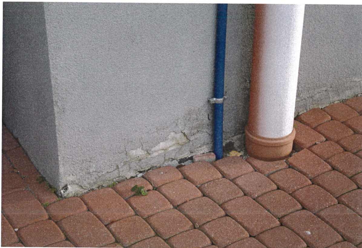
Zdjęcie nr 19 – Wykonanie nowego tynku na cokole ściany szczytowej