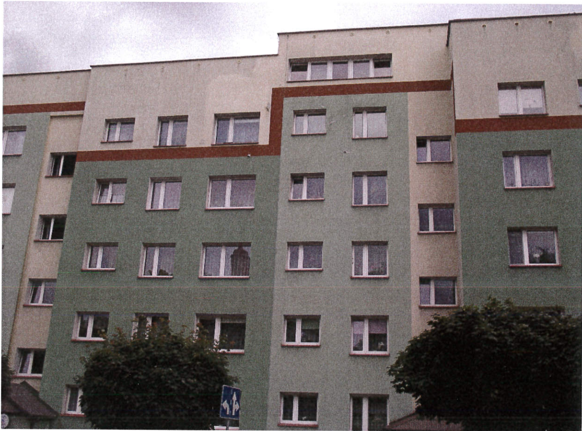
Zdjęcie nr 2 – naprawa elewacji