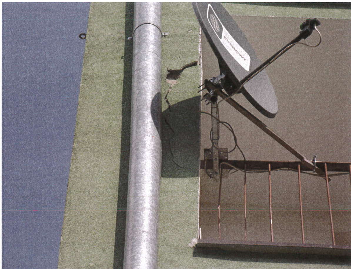
Zdjęcie nr 15 – naprawa dolnej części elewacji budynku