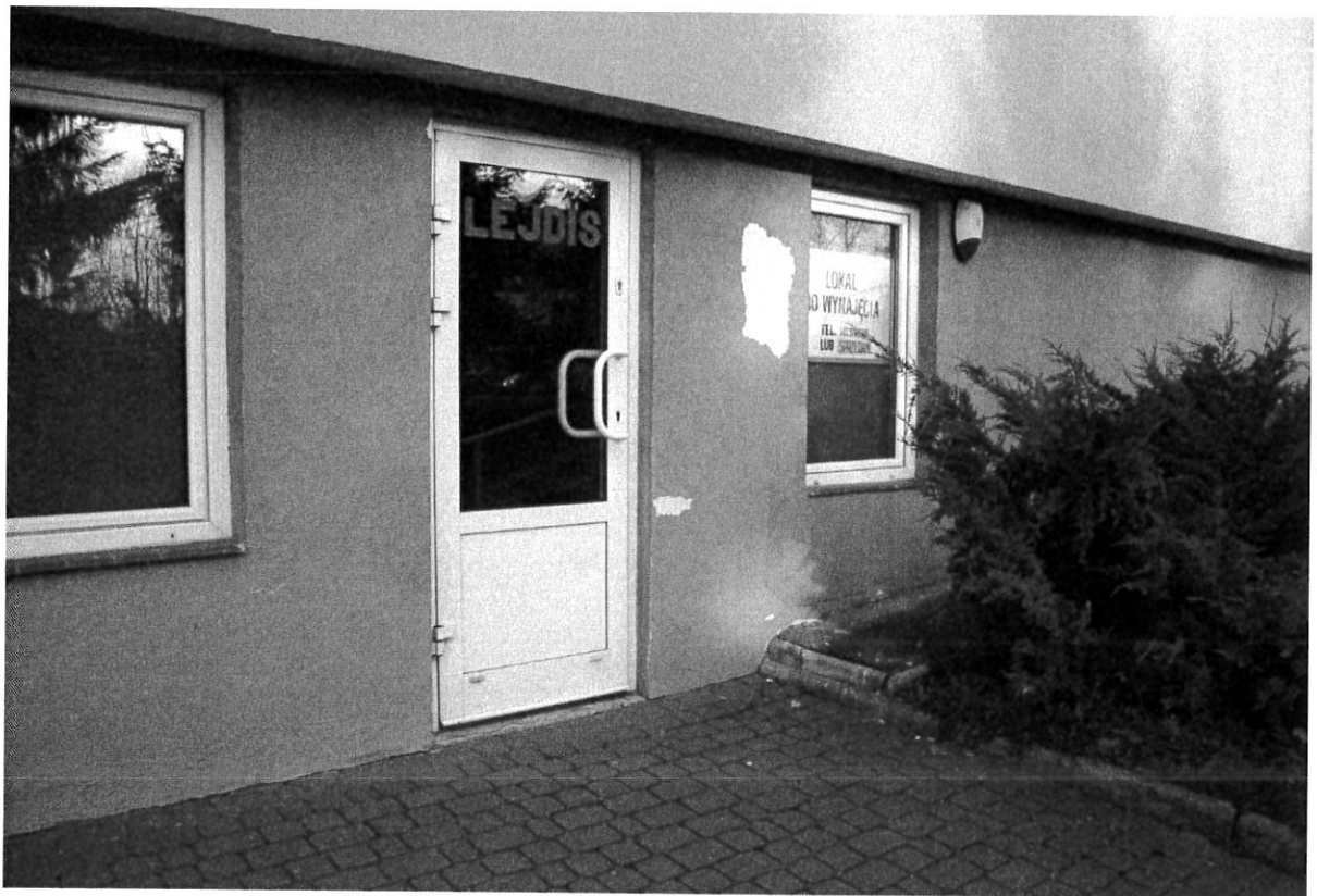
Zdjęcie nr 17 – naprawa dolnej części elewacji budynku